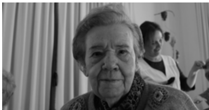
I Pepita no es quede curta.