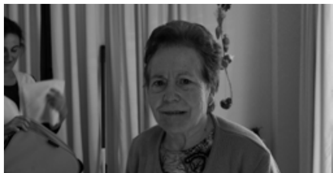
Vicentica molt ben arreglada.