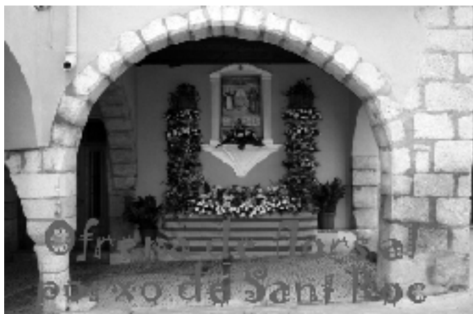
Aixina de florit va quedar també el porxo de Sant Roc després de l'Ofrena.