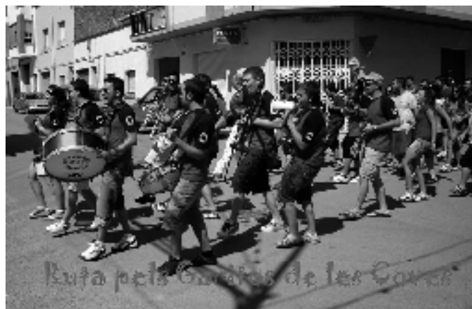
La Xaranga Local «Ximiraxa» va acompanyat als 150 joves que van esmorzar pel matí junts a la Pista de la Ravaleta. Després pegaren una volta pels Garitos de les Coves.