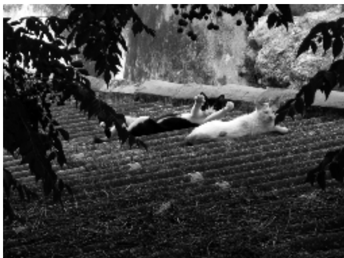
Les festes, si es viuen intensament són realment molt cansades. Fins i tot els gats fan la becadeta després de dinar.