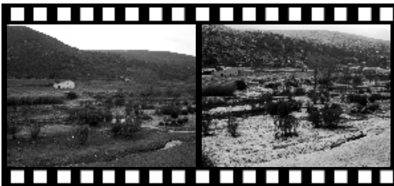
La confederació Hidrogràfica del Xúquer, instada per l'Ajuntament, està netejant el llit del riu de les Coves. En les fotos, el llit net del riu a l'altura del molí de la Cava i una altra foto amb l'indret nevad del mateix lloc.

El 26 de desembre es va celebrar assemblea de la Unió Musical Covarxina per tal d'escollir nous membres de la directiva.