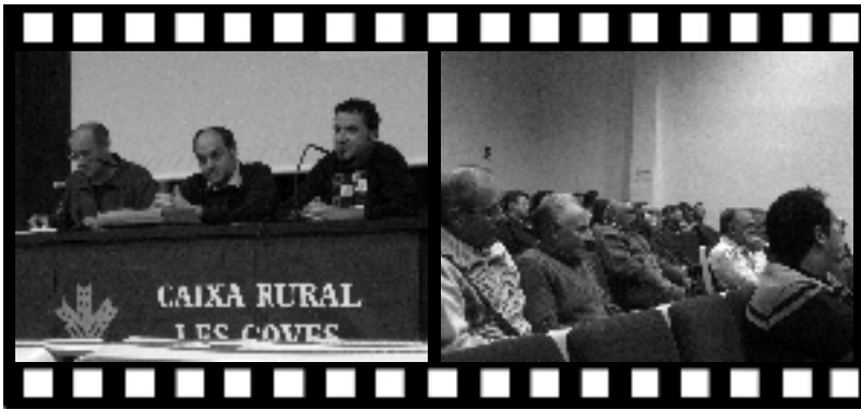
El 26 de novembre es va organitzar per part de l'Ajuntament una xarrada informativa al Saló d'actes de la Caixa Rural sobre les obres de l'antiga carretera.