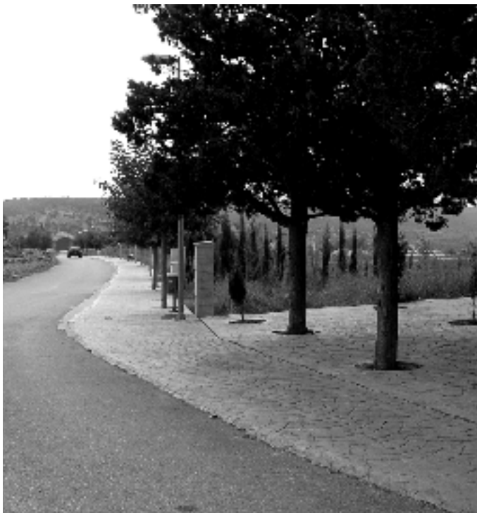
FOTO: Un treballador de l'Ajuntament mostra les arquetes.

Després de formalitzar la corresponent denúncia a la Guàrdia Civil, segons indiquen fonts municipals, l'Ajuntament reposarà el servici a la major brevetat possible tenint en compte que és un camí molt utilitzat per a passejos, tant per el dia com a primeres hores de la nit.