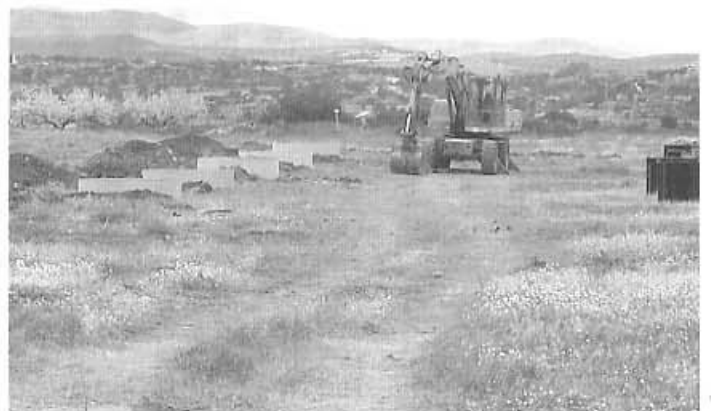
Vista de la planta fotovoltaica