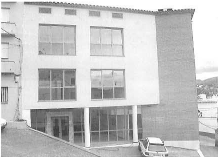
El Museu de Roures comença a prendre forma