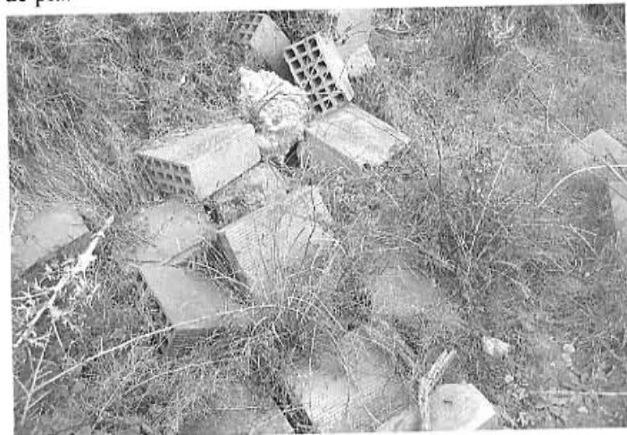
Toves per condicionar la font

És al marge esquerre del Barranc del Bosc, ben a prop d'una mena de cova que hi ha entre els detritus al·luvials d'aquest marge. La presència d'algunes jonqueres ens palesa, de lluny, l'indret on és la font. Des del llit del barranc, per arribar-hi cal grimpar el pendent o seguir barranc amunt per anar més de pla.