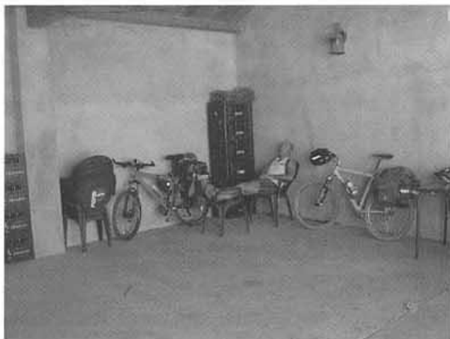
Una becadeta després de dinar