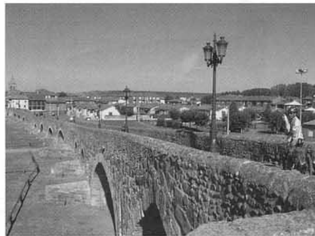
Entrada pel pont d'Hospital d'Órbigo

(Continuarà al proper número de Tossal Gros)