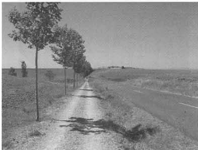
Rectes i més rectes