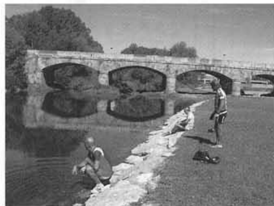
Piscines naturals de San Justo de la Vega