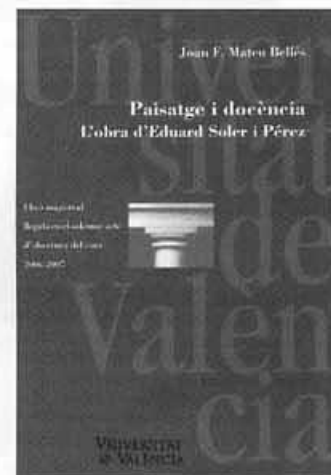
La lliçó magistral