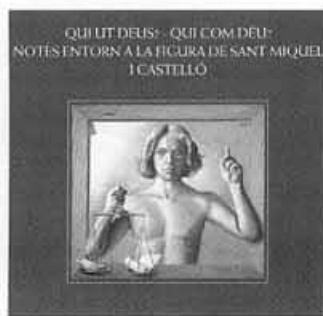
Catàleg monogràfic de Sant Miquel