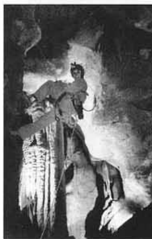
Ressalt de 5 metres

Dibuixat: Antoni Llop, Montserrat i professional: M. Ruediger i Fco. Galland