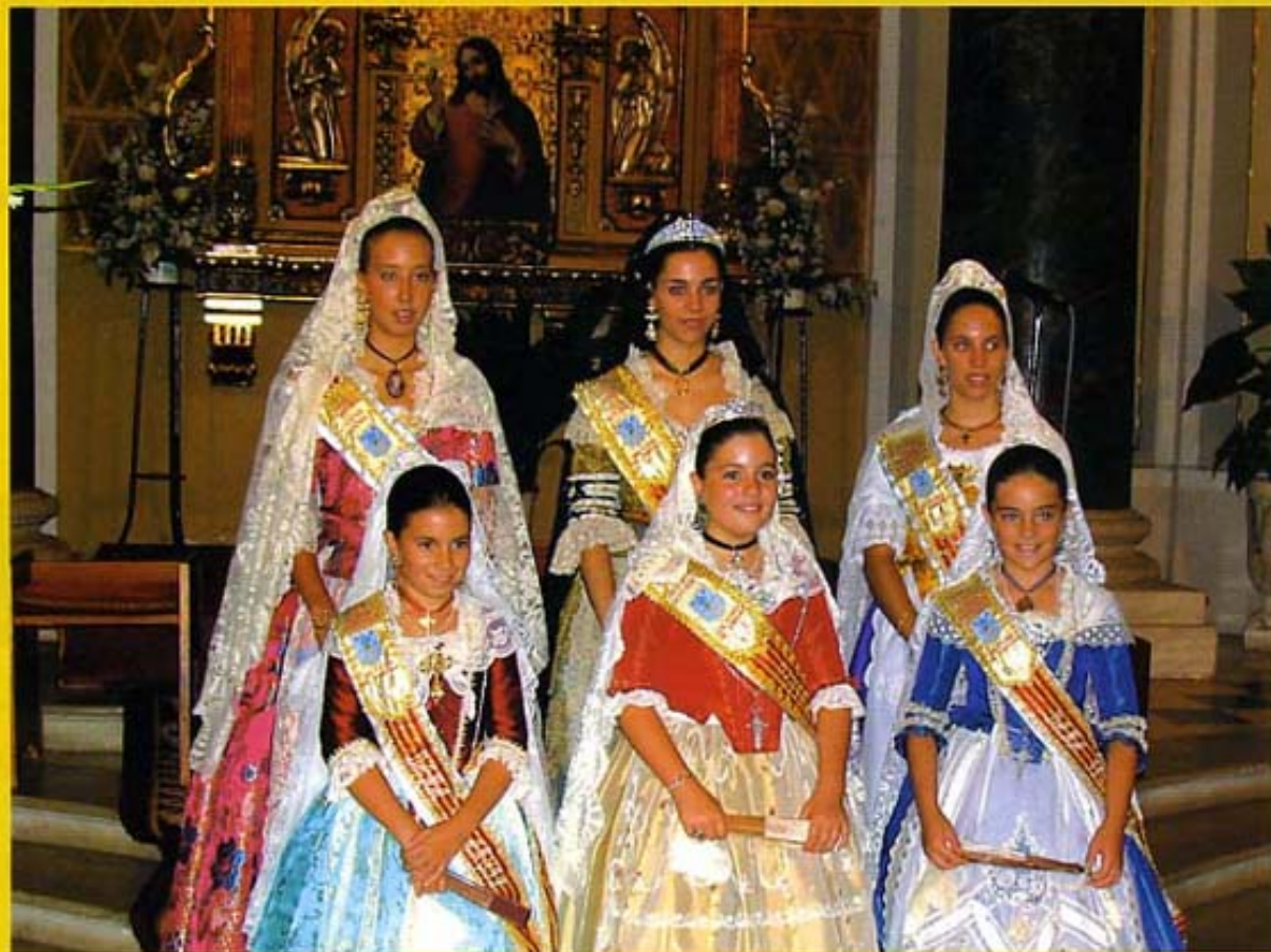
REGINES I DAMES DE LES FESTES D'AGOST 2006

La present publicació ha rebut una ajuda de l'Acadèmia Valenciana de la Llengua