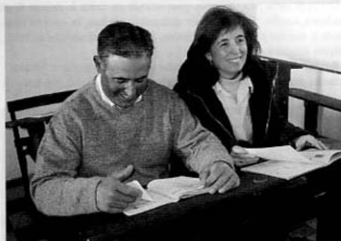
Aquesta és la foto portada nº 105 que il·lustrava el text: "Rehabilitació Escola Mas d'En Ramona".