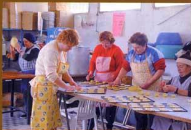
Sant Antoni al Mas d'En Rieres