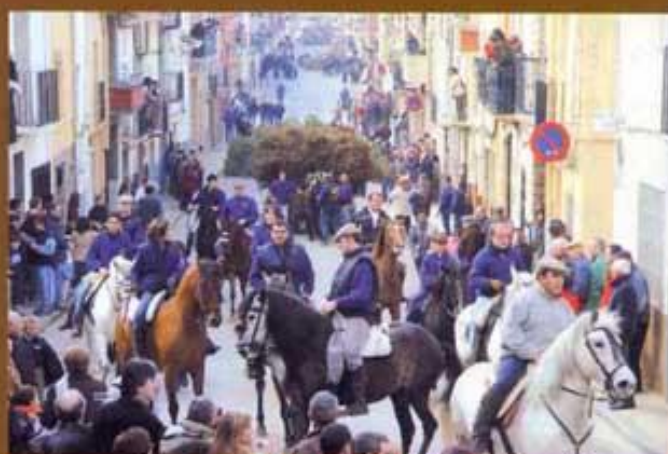
Sant Antoni al poble