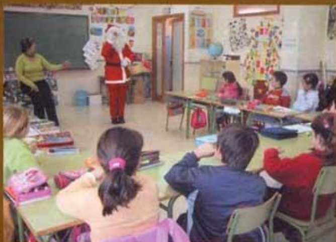
Rehabilitació escola Mas d'en Ramona