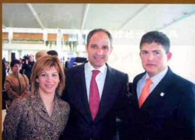
Les Coves a Futur (Madrid)