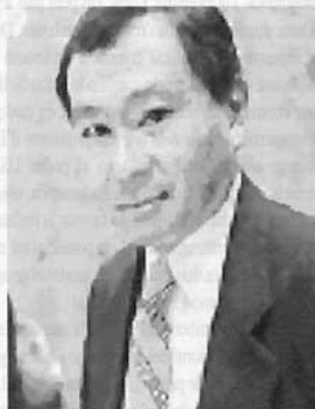
Francis Fukuyama (1952), Màxim exponent de la política neoconservadora americana

Un període d'entre guerres convuls, on els derrotats de la Primera Guerra Mundial s'alinearen amb el feixisme, i una Societat de Nacions incapaç de proposar una pau justa, prologaren el conflicte més gran que ha viscut la humanitat: La Segona Guerra Mundial, augurada per la Guerra Civil Espanyola. Suposà l'enfrontament entre diverses formes de conce-