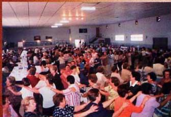
Trobada de Mestresses de Casa