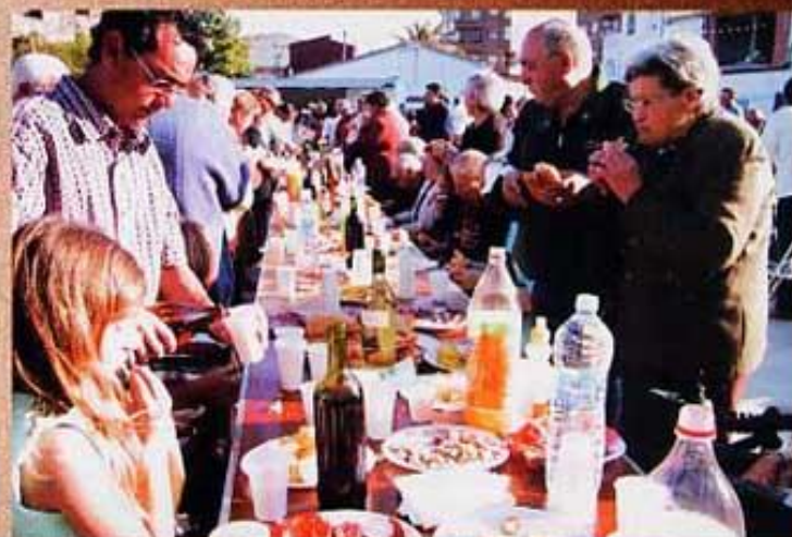
Dia del Cooperativisme