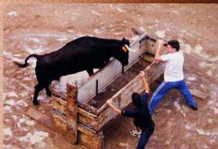
Festes de la Joventut