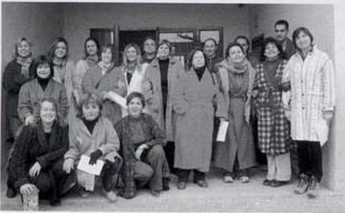
Consigna: mestres amb batfí, què guapos/es !!

El dijous 3 de febrer per la vesprada, vam anar a l' ermita de Sant Vicent a menjar-nos la truita ; vam tindre molt bon dia.