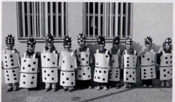
Dòmino: alumnes de 5 anys.