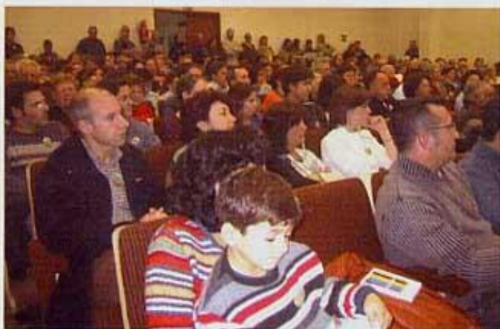
L'assistència desbordà totes les nostres previsions.