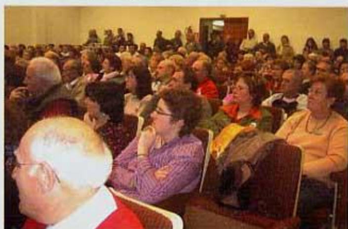
El saló estava ple. Més de 250 persones...