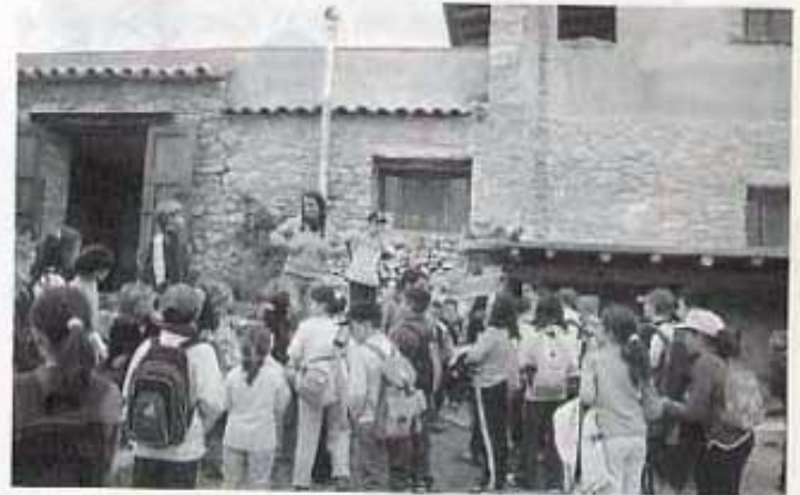
Arribada al mas de Miguelito.