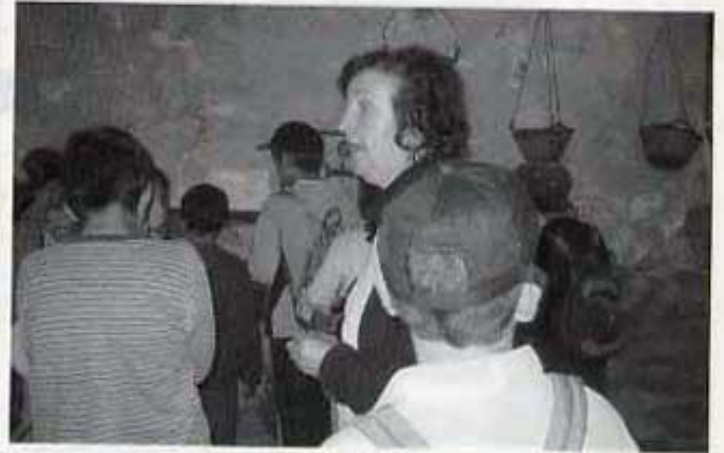
Ens ho van explicar tot molt bé.