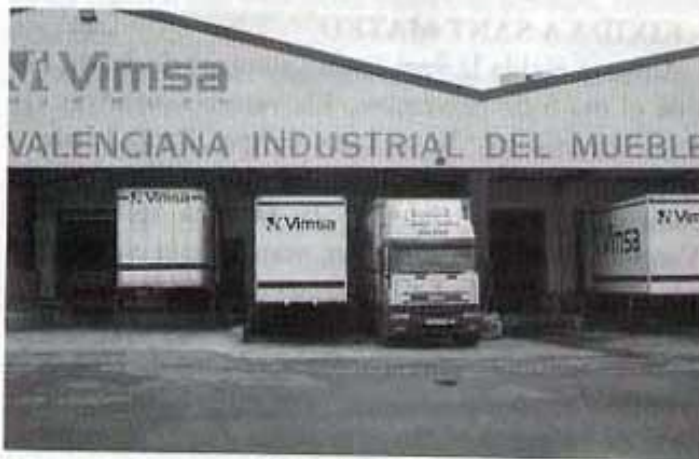
Fàbrica de mobles.