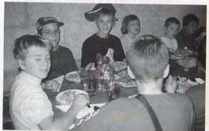
Arribada al mas de Miguelito.