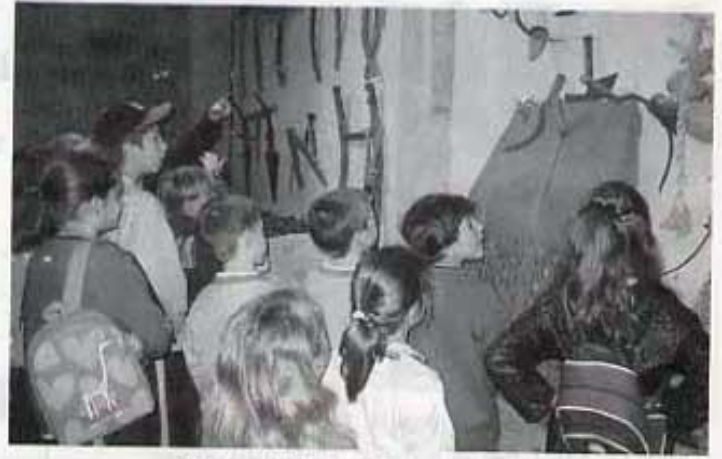
Museu de les presons medievals.