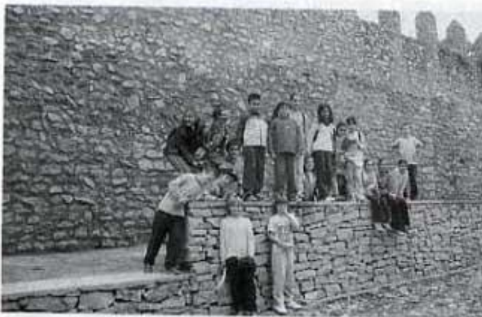
Muralls de Sant Mateu.