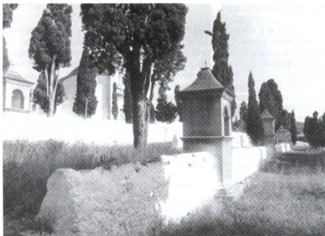
Capelletes4.- Úniques restes dels originals plafons ceràmics del Via Crucis del Calvari covarxi.

Sempre he tingut bona acollida per part de les persones consultades. Totes elles són veïnes i veïns que generosament els agrada transmetre el que saben, per a fer feliç i sentir-se útils.