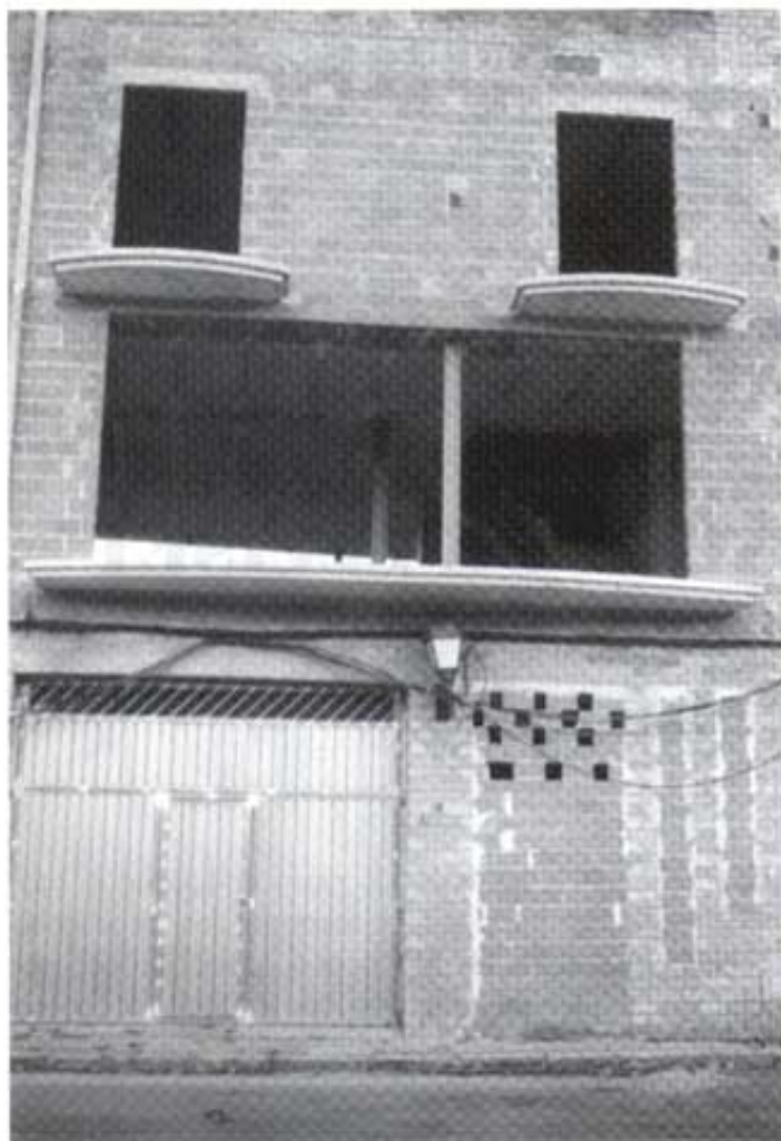
Capelletes2.- Capelles del Via Crucis primitives (s. XVIII) construïdes de pedra tallada, situades a l'últim tram del recorregut. Les dues més fondes estan refetes amb restes de les altres, desmuntades per a fer el pont de les Capelles.