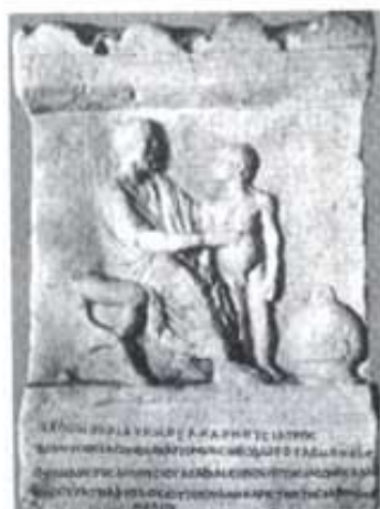
El metge Jasón visitant un xiquet. Relleu romà de marbre pentèlic. British Museum