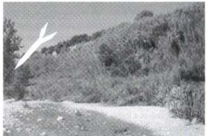
La fletxa indica on és la font