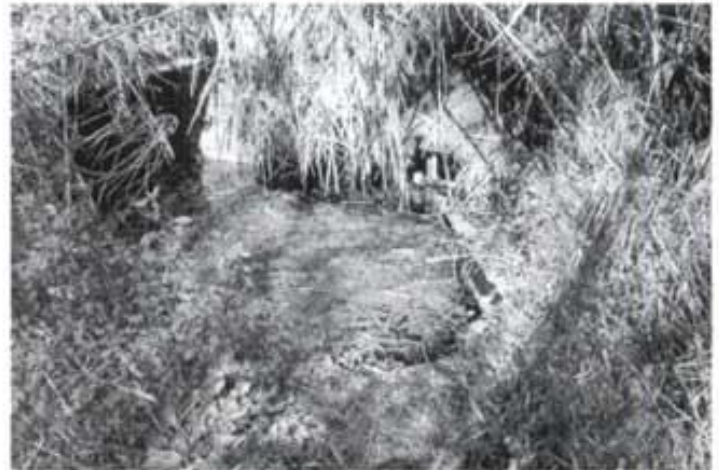
La bassa on raja la font

Quan arriba l'aigua corrent del poble, minva la utilització de la font que avui ens ocupa, encara que opcionalment el motor elèctric ans esmentat por seguir fent la seua tasca, la d'omplir les basses de la Caseta.