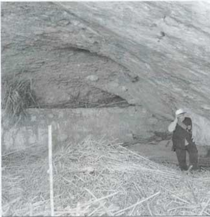
La sèquia de la Cova Joana demana una neteja.

d'Ocupació, etc. Des de l'Agència d'Ocupació i Desenvolupament Local s'està pendent de les convocatòries que puguen ajudar a l'exitosa execució del projecte.