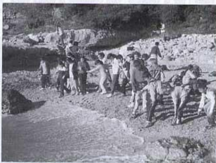
Vam esmorzar i qui va voler es va remullar.