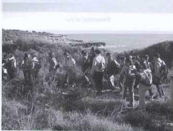
A la dreta la costa i a l'esquerra el barranc.

Eixe dia, pel matí vam anar a conèixer una miqueta millor, les costes i els barrancs de la Serra d'Irta (Alcossebre). Vam dinar al Parc dels Ànecs de Peníscola i de 3 a 5 vam fer una visita guiada pel Jardí dels Papagais que es troba entre Peníscola i Benicarló. Ací, els xiquets i les xiquetes s'ho van passar molt bé ja que van poder veure, conèixer i tocar moltes aus exòtiques que els van encisar: cacatues, lloros, cotorres, papagais..., i també cangurs. La visita va concloure amb una gran actuació d'algunes de les aus del jardí.