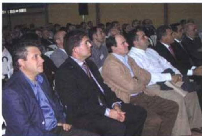
Autoritats assistents a la presentació.