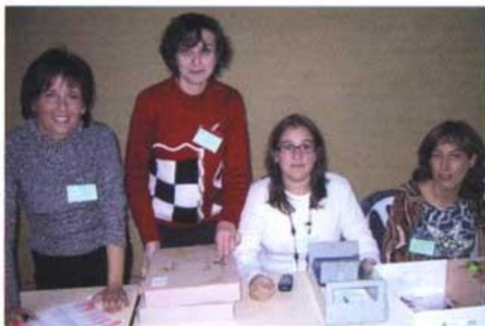
Repartint les carpetes i material.