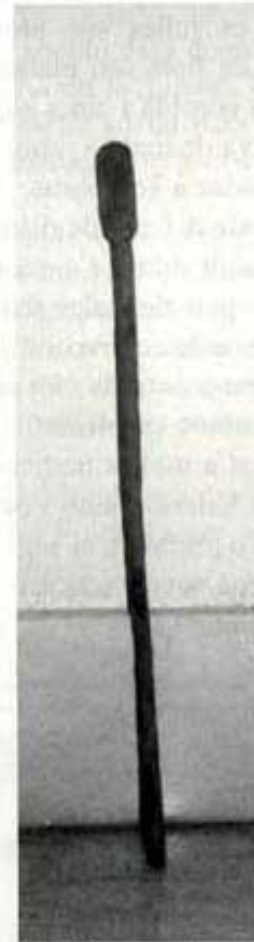
Cullera per regirar.