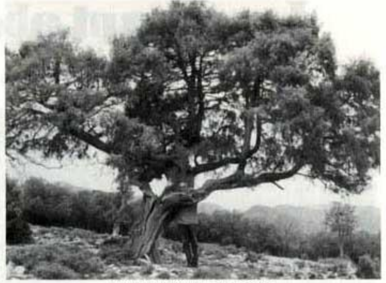
Aquest arbre tan gran és un càdec.