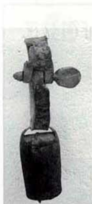
Collar amb clevilla.