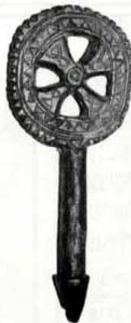
Una clevilla ben treballada.