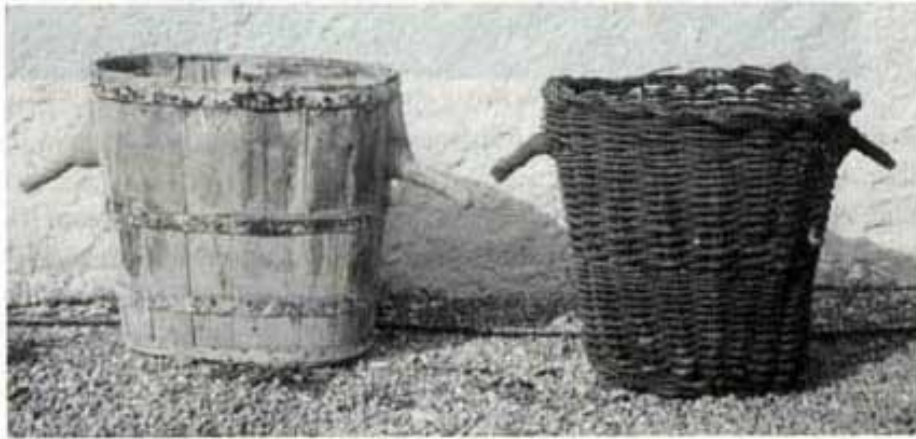
Portadora i banasto.