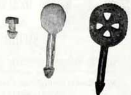
Un botó i dues clevilles.