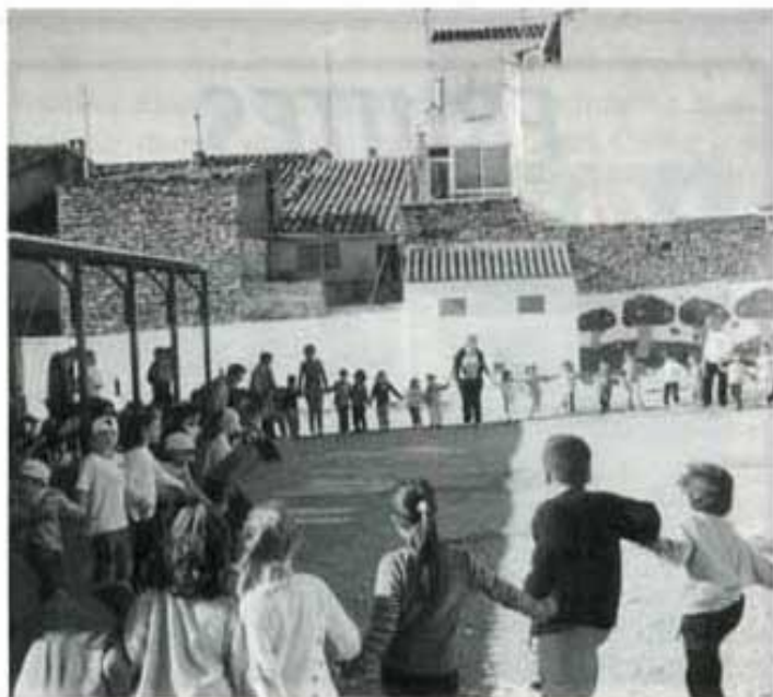
Després vam esmorzar a l'escola amb els companys d'edats semblants. Seguidament vam cantar i ballar la cançó "El dia de la trobada".