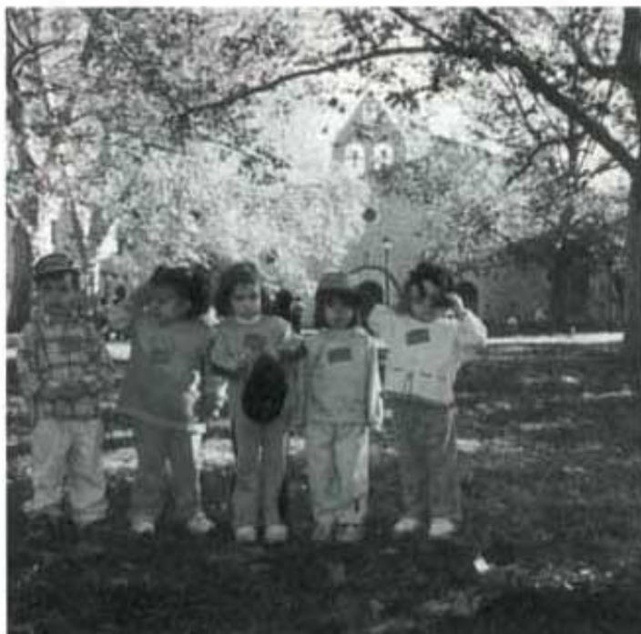
En primer lloc vam visitar l'ermita de Sant Pau.