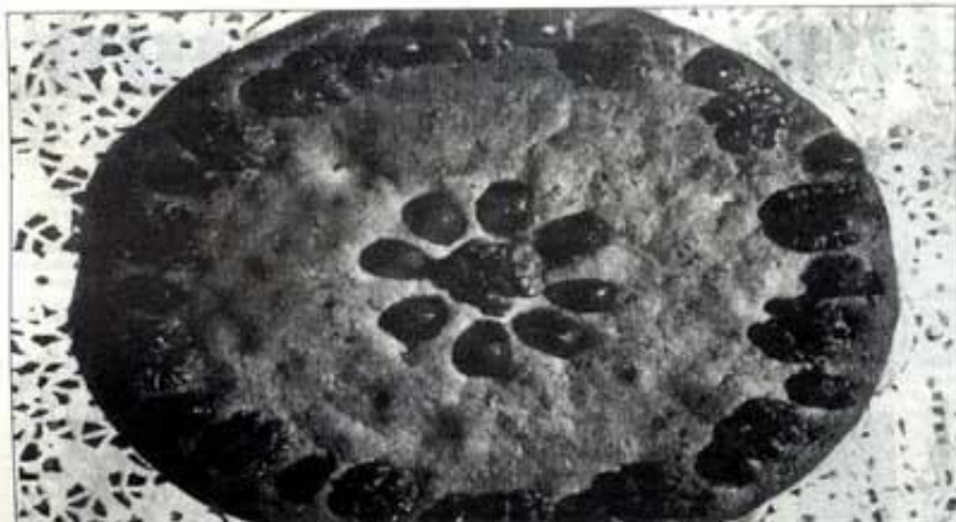
Uno de los pastes cuya receta aparece en el libro

EMILI FONOLLOSA LES COVES. — La Asociación Cultural Tossal Gros de Les Coves de Vinromà da un importante paso más por salvaguardar las costumbres y tradiciones de esta población de la Plana Alta con la elaboración de un libro dedicado exclusivamente a sus pastas típicas hechas al horno.