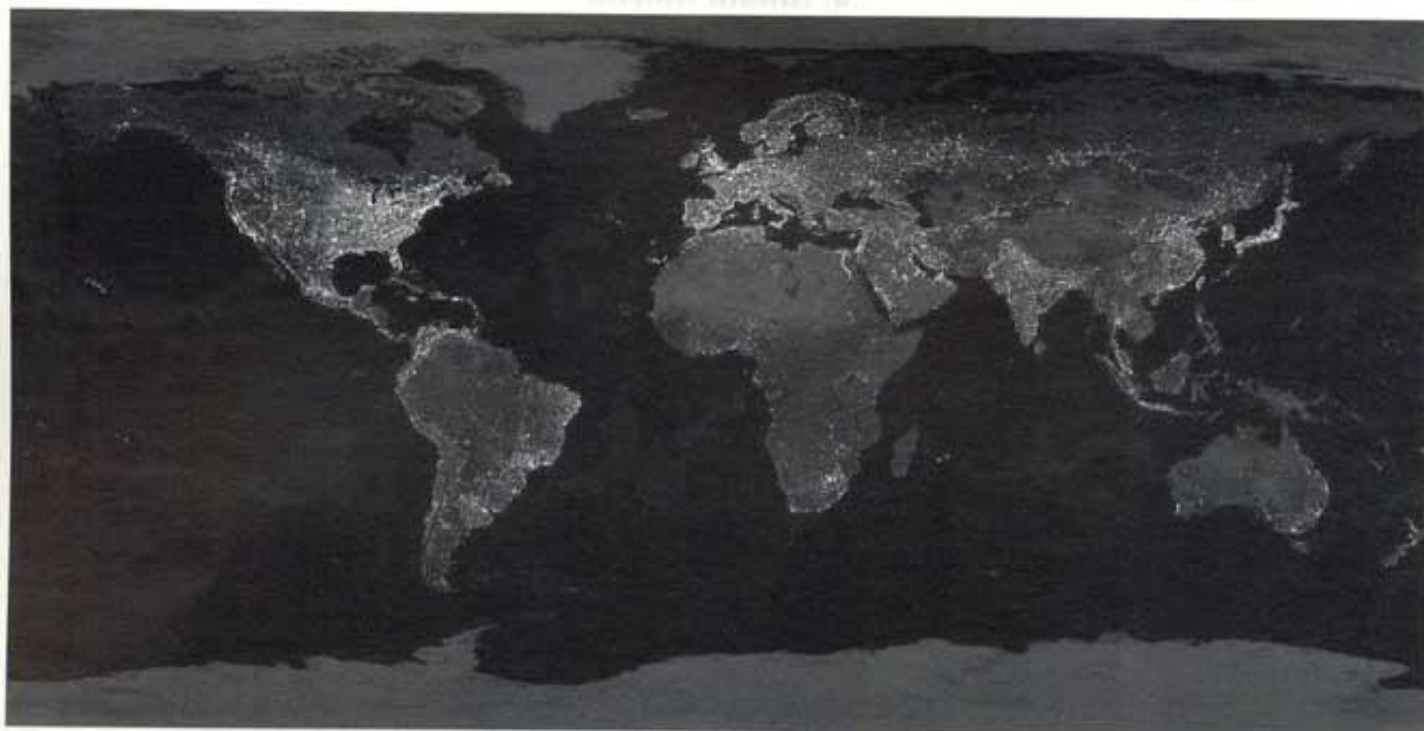
El mundo por la noche.

Mirad qué curioso: es una foto real del mundo visto por la noche.