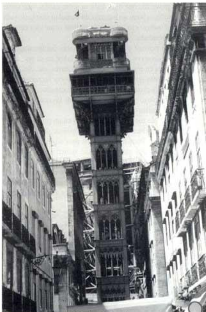
L'elevador de Santa Justa.