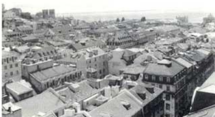
L'elevador de Santa Justa ofereix una vista privilegiada de la ciutat des del centre. Al fons, el Tejo.