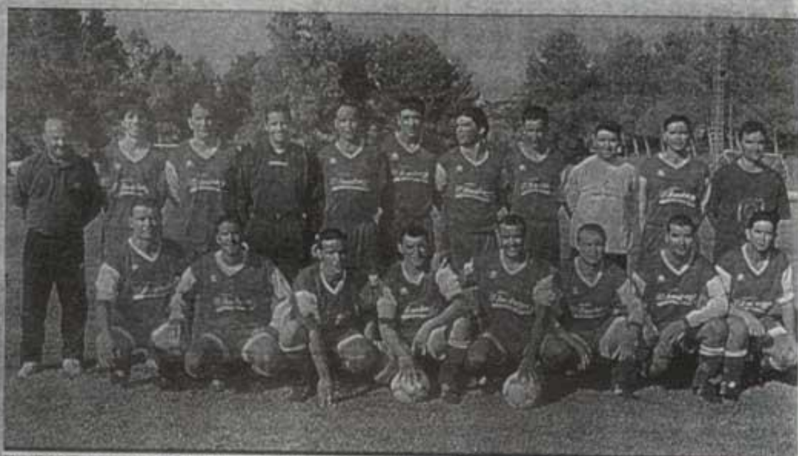
El equipo 'rojillo' presenta un total de nuevas incorporaciones en su nuevo proyecto.