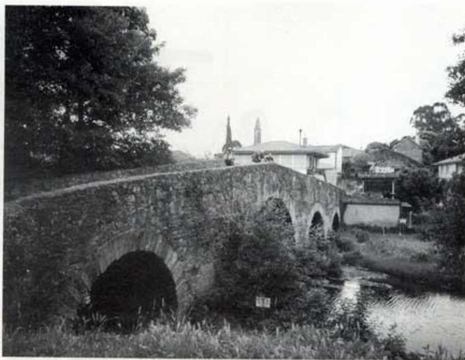
Pont medieval de Furelos.

Seguint aquest meravellós espectacle natural, arribem a Barbadelo, petit llogaret que conserva una interessant església romànica; i també hi ha un alberg ben condicionat. Per completar l'escena, les vaques que