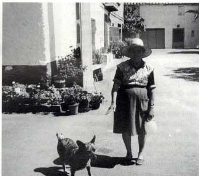
Rosa Escó i el seu gos vénen de la font.