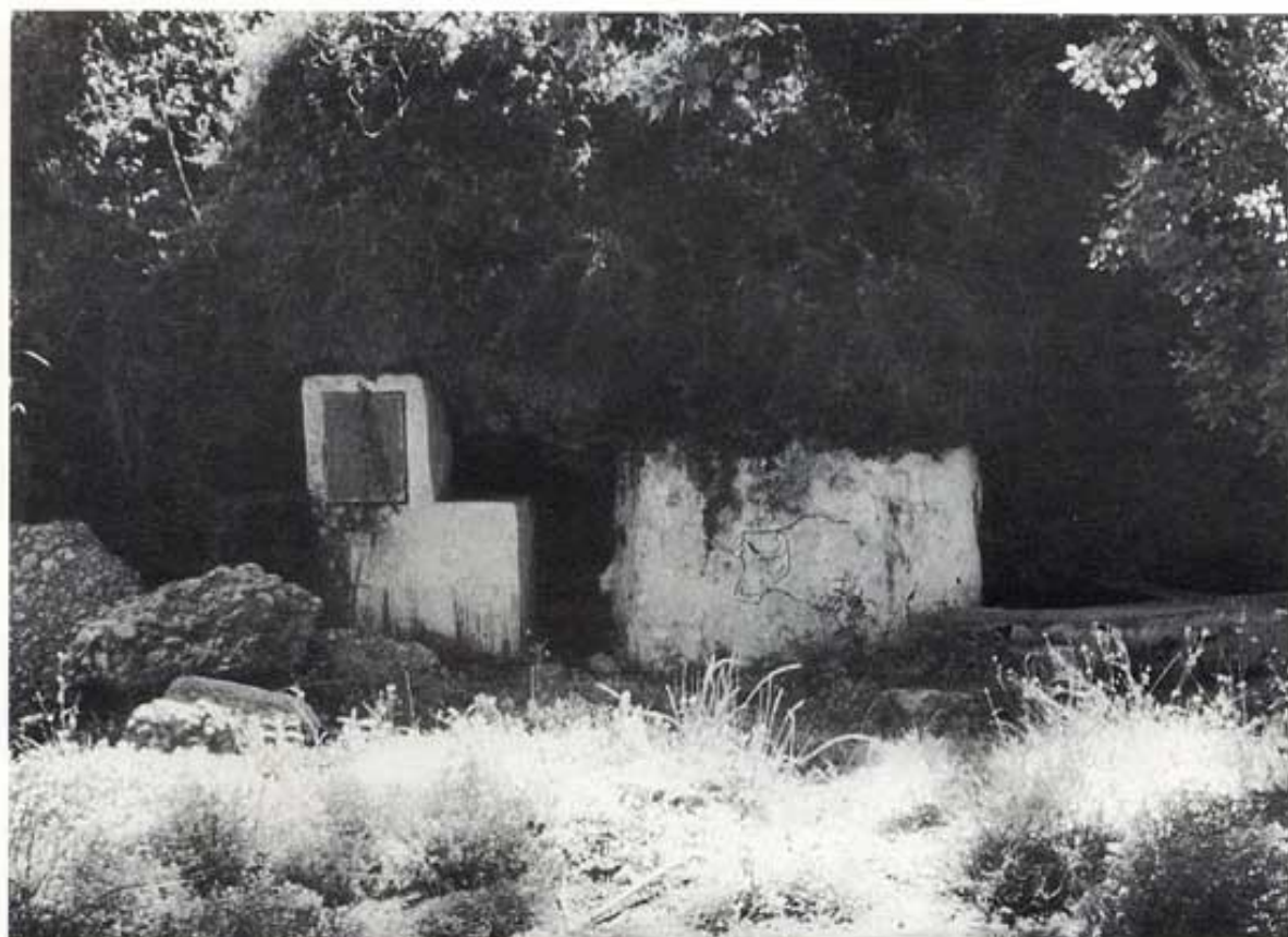
A l'esquerra el dipòsit. A la dreta la silueta del bou.

canterelles per delectar-se d'aquesta aigua, fresquívol i d'una finor excel·lent; recordem que les aigües que naixen cara al nord destaquen per la seua qualitat i frescor. "Don Julio Ortí", metge famós de les Coves, deia, referint-se a les propietats de l'aigua d'aquesta font, que els veïns podien estar tranquils perquè mai encomanarien el tifus. També deu ésser rica en calç, ens ho palesa les acumulacions calcàries dipositades entre la canaleta que va al safareig i la