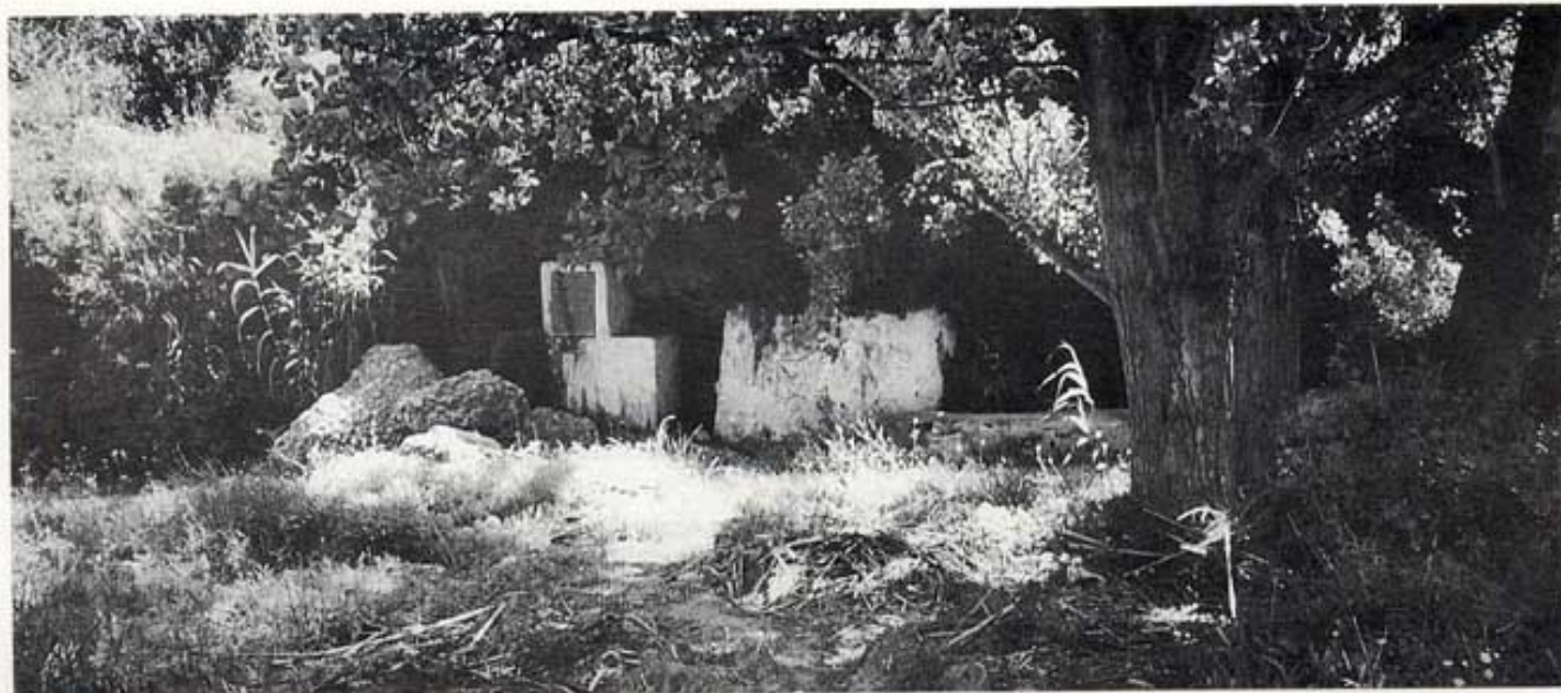
El paratge de la font.

Al marge esquerre del barranc homònim, en un paratge ombrívol i protegida per una cova s'hi formava una clotxa on la gent del mas s'abastava d'aigua, des de sempre, com podia.