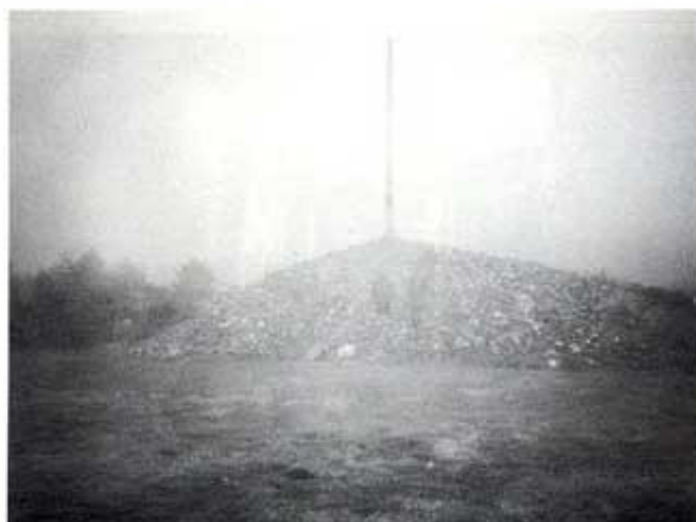
Creu del Ferro, envoltada per la boira.

Rabanal té una església de traces romàniques. A hores d'ara, s'hi ha instal·lat una comunitat de monjos benedictins (anomenada del Monte Irago ). Es tracta de monjos escindits de Silos, perquè no accepten la