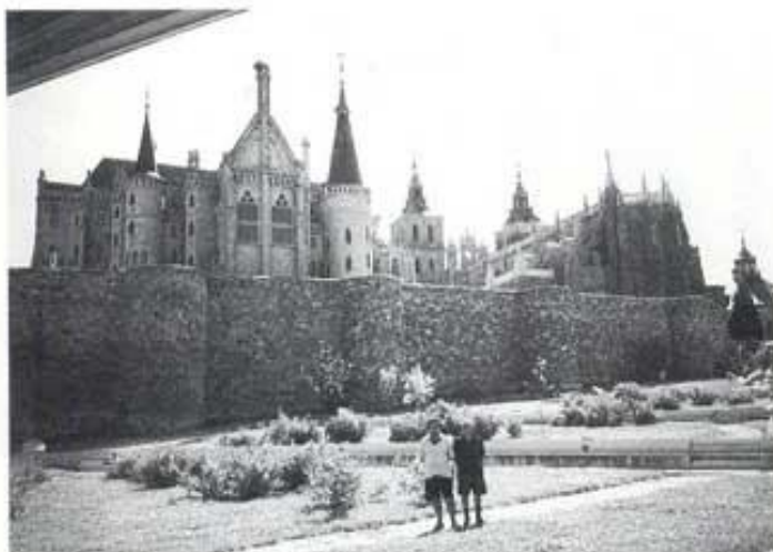
Muralles, palau episcopal i catedral d'Astorga.