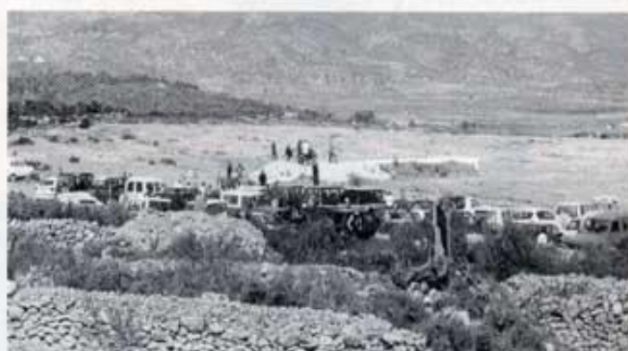
Gran afluència de públic.