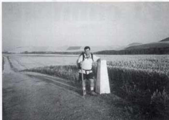
FOTO 4. Límit de Castella - lleó. Blat i més blat.