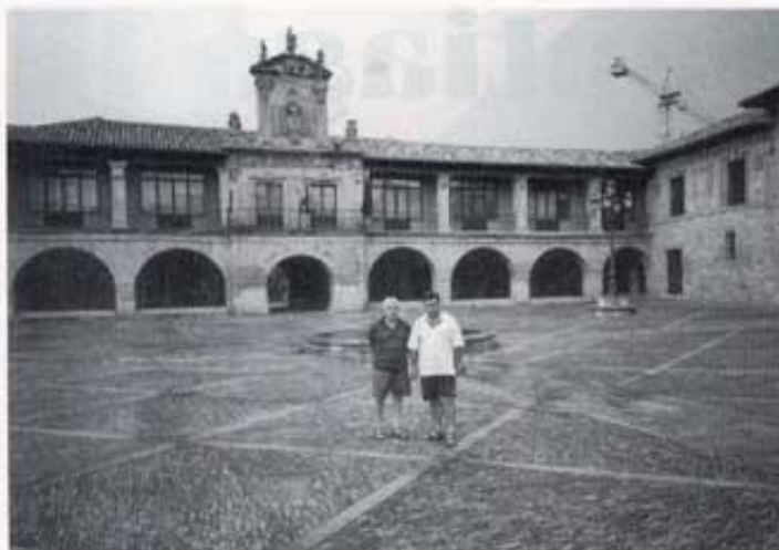
FOTO 3. Plaça major. Santo domingo de la Calzada.