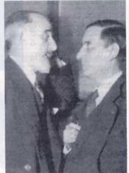
Lluís Lúcia i el líder de la Lliga Catalana, Francesc Cambó, al Congrés del Diputats.

Gràcies a tots per aquest record d'aquell gran home, d'aquell gran valencià, d'aquell senzill home que va néixer al vostre poble.