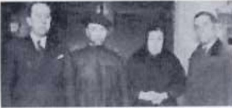
Lluís Lúcia i Gil Robles amb un matrimoni de llauradors valencians.

casa- el 5 de gener de 1943. Als cinquanta quatre anys, va morir jove, jove per a l'època i més jove per a hui. Malgrat això la seua obra ha quedat fins ara.