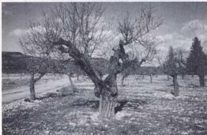
Protuberància anular a la soca d'un ametller que era de carròs.

Per concloure, cal pensar que, si a poc a poc ha desaparegut, és tracta d'una classe de poca qualitat i poc interessant. Jo, almenys per curiositat, n'empeltaré uns pocs, els observaré i intentaré conèixer l' Ametller de Carròs més a fons.