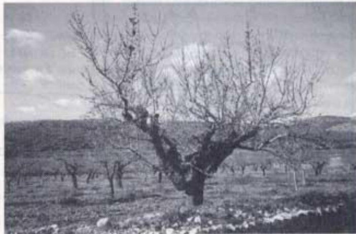
La soca és de carròs però no ho és el ramatge.