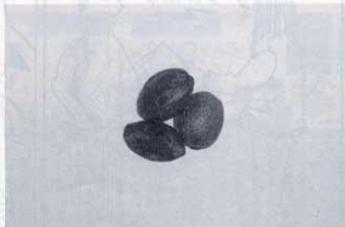
Tres ametlles de carròs.