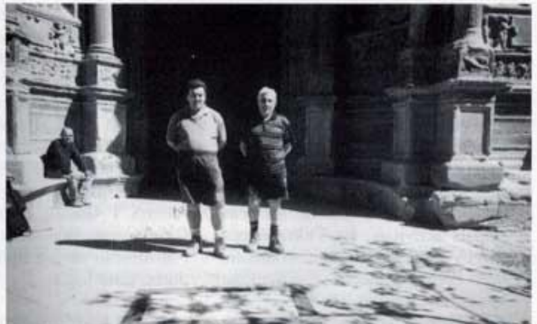
Foto 18: Lloc on està enterrat Cèsar Borja, a l'església de Sta. Maria de Viana.