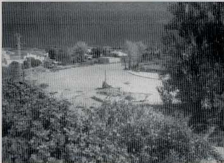
El sol asoma tras el oscuro cielo.