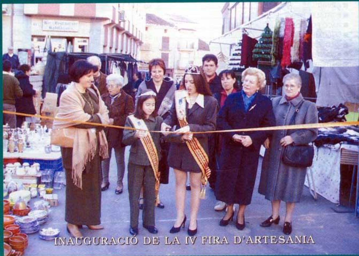
INAUGURACIÓ DE LA IV FIRA D'ARTESANIA