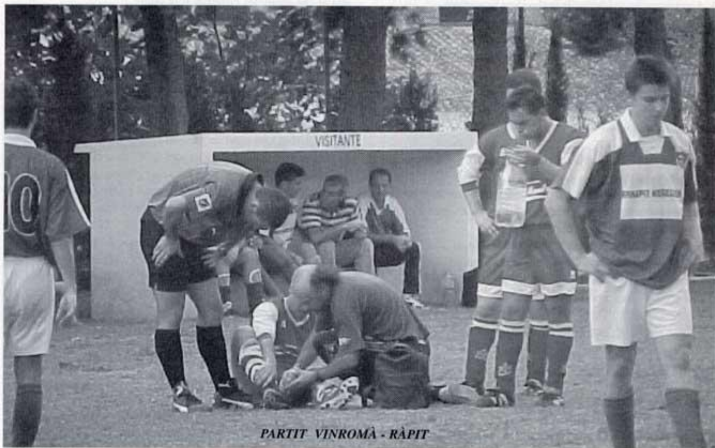
PARTIT VINROMÀ - RÀPIT