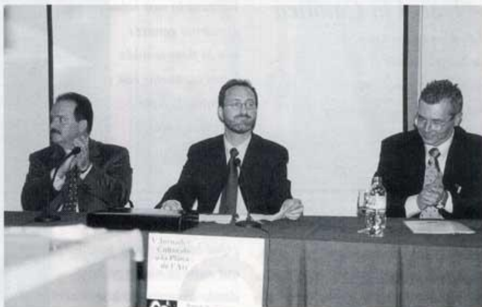
Inauguració de les Jornades.

En la seua gestió va col·laborar gairebé tot el poble i puc afirmar que deixaren el llistó molt alt. Conferències, exposicions, taules