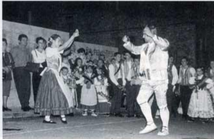
Actuació del Peiró.