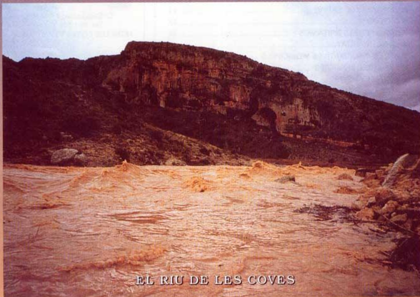
EL RIU DE LES COVES