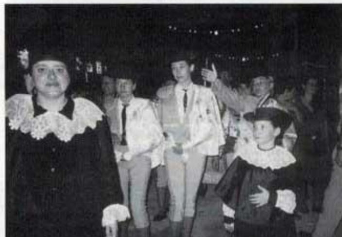
Toreros guanyadors del concurs de disfresses.