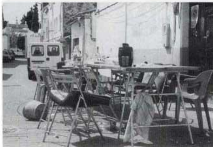
Ressaca d'una nit de festa.