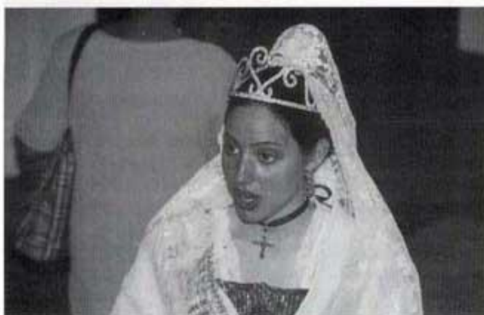
La Regina de Festes.