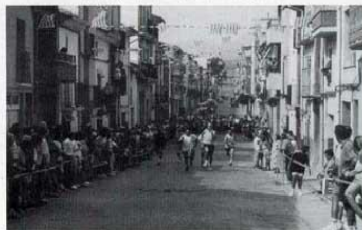
La Joia. A pel conill/pollastre!