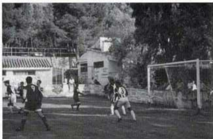
El partit de futbol: Vinromà-Castelló.