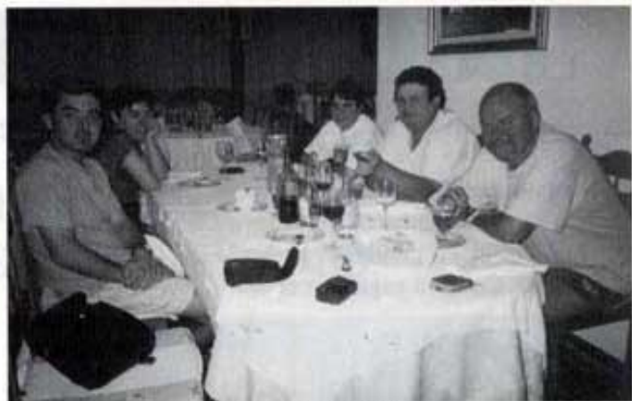
Dinàrem a "La Fonda".

Només em queda dir: Passejar per plaer i amb bona companyia, relaxa el pensament donant pas a l'alegria.