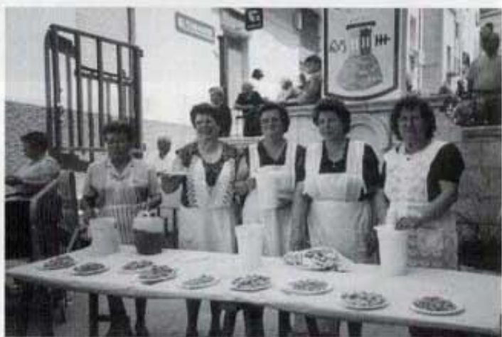
Ames de casa. Cacaus i tramussos.