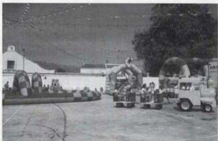
Diada infantil a la Ravaleta.