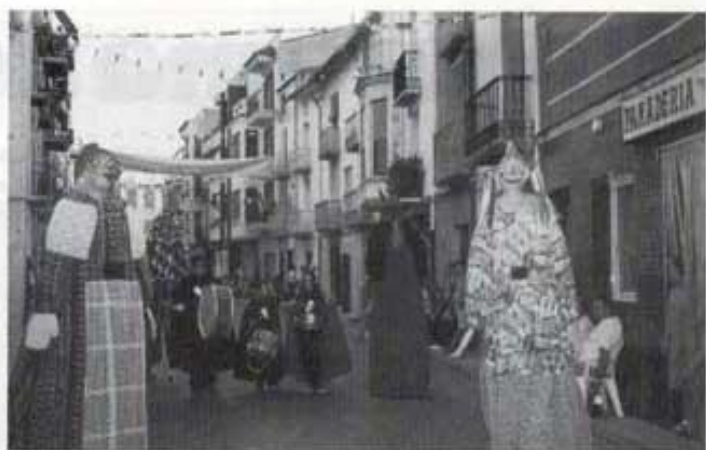
Gegants i dimonis.

El carrer Lluís Lúcia Lúcia ret homenatge a un covarxí il·lustre nascut l'any 1888 i mort a València el 1943. Fou fill de notari, deixeble del pare Vicent (el promotor dels nuclis catòlics socials de caràcter paternalista). Presidí les Joventuts Carlines a la Universitat de València, on cursà els estudis de Dret i dirigí "El Requeté Universitario". Atrè pel periodisme, fou director del setmanari "El Guerrillero", i el 1911 formà part de la primera redacció del "Diario de Valencia", òrgan oficial de la Comunió Tradicionalista Valenciana, del qual fou ben aviat director. En produir-se l'escissió mellista cap al 1919, abandonà l'ortodòxia jaumista (dels seguidors del pretendent tradicionalista al tron d'Espanya Jaume IV, duc de Madrid), posició que fou seguida per la gran majoria del tradicionalisme valencià. El 1931, proclamada la II República, fundà la Dreta Regional Valenciana que, juntament amb Acció Popular, fou la base de la CEDA. Lluís Lúcia fou el màxim orientador i dirigent de la DRV. Una característica del partit era la modernitat i l'eficiència de l'estructura interna, basada