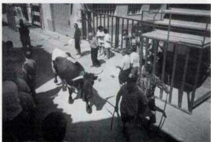
Bous de Vila. Entrada.