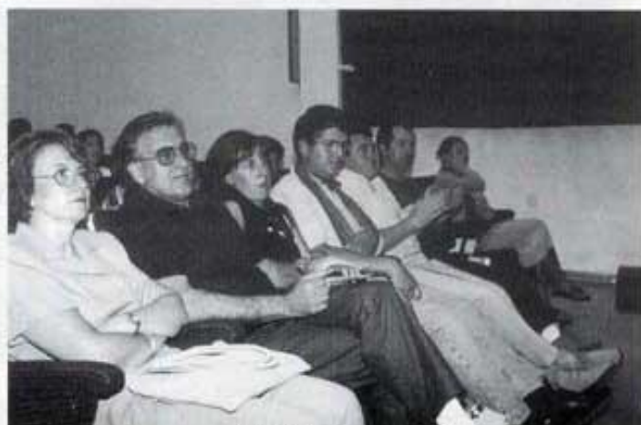
També les autoritats.