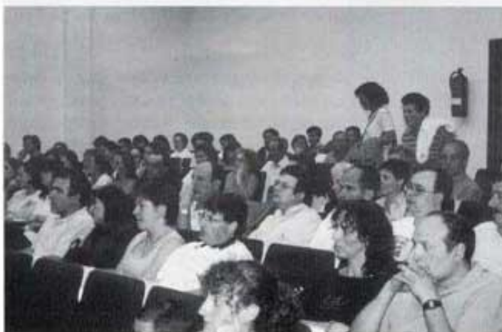
Va assistir nombr's públic.