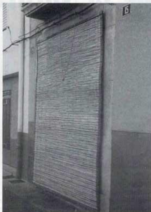
Canyis al carrer Sant Tomàs.