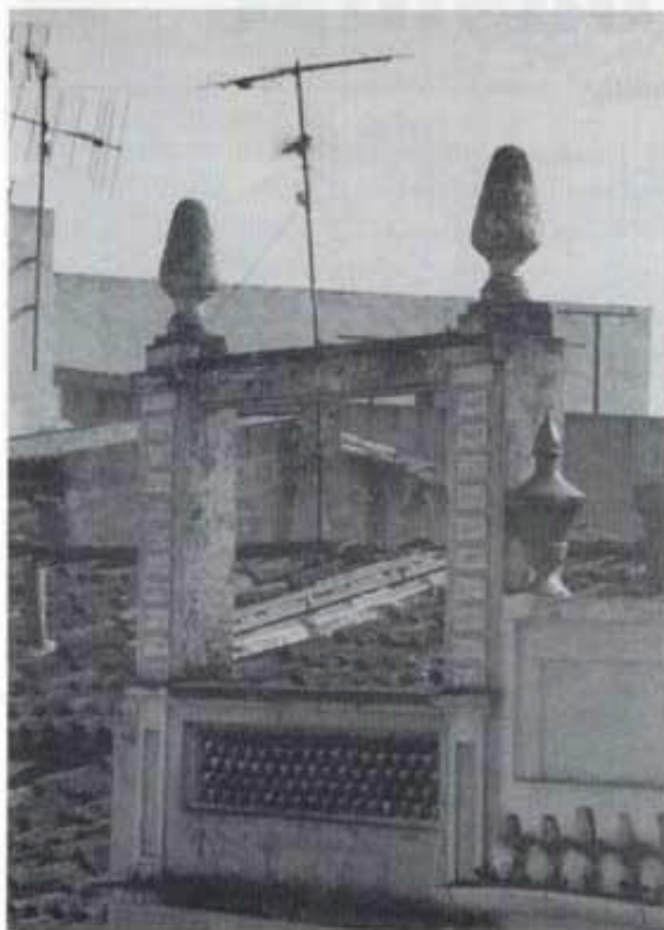
Façana modernista del carrer Boix Moliner.