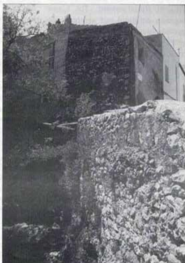
Baixador del camí Nou pel carrer Tiradors.

La pretensió d'este espai és, precisament, eixa: treure de la foscor els DETALLS D'UN POBLE.