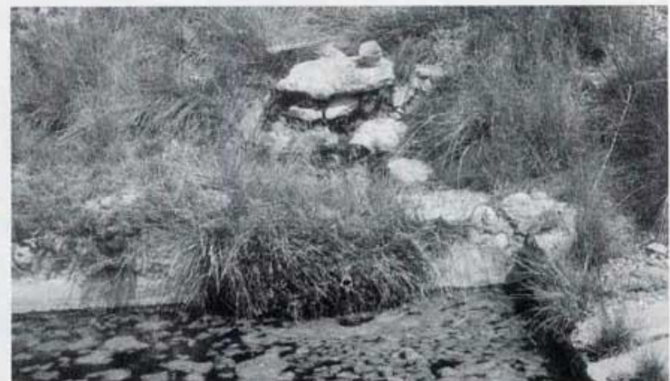
La font raja gràcies a una xicoteta canonada.