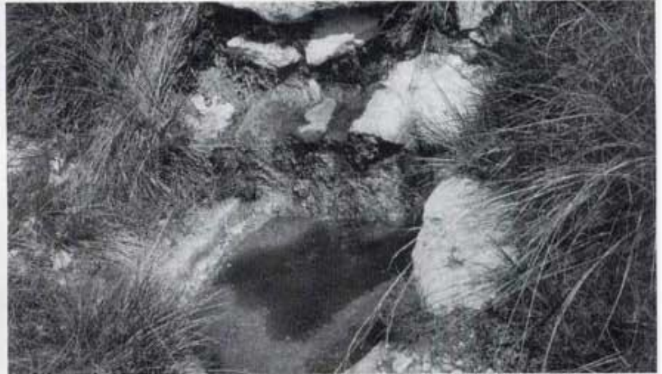
Per on ara xuma abans rajava.

Aquesta font, endemés de regar els horts, apaivagava la set dels vianants que utilitzaven el camí estret, gairebé esborrat, que ve de la Caseta, passa tot a frec, i enllaça amb el camí de carro anomenat de les Matasses.