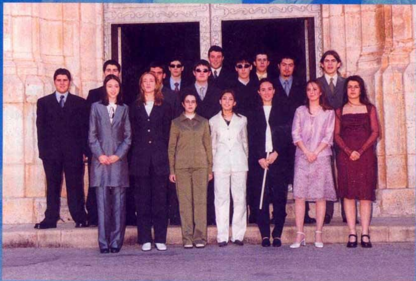
QUINTA DEL 2000