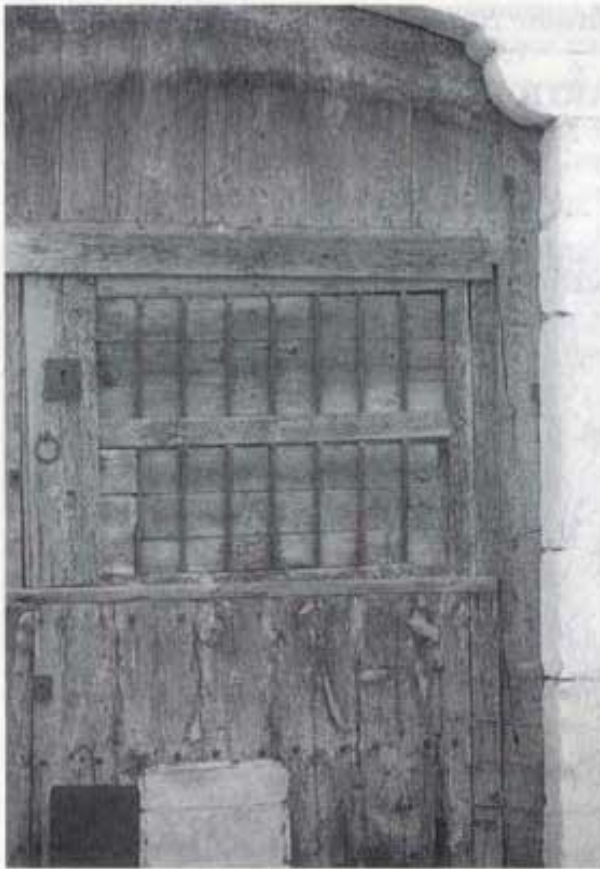
Porta, Carrer Castelló, damunt de la Font de la Vila.

Vivim de forma accelerada, el temps s'esmuny com aigua en cistella ( Tempus Fugit , diu un rellotge de sol de la Plaça Espanya) i no reparem en xicotets detalls que ens envolten. Detalls que, malgrat la seua petitesa, tenen el seu sentit, encara que tal vegada en un altre món menys vertiginós on pugueren ser millor apreciats.