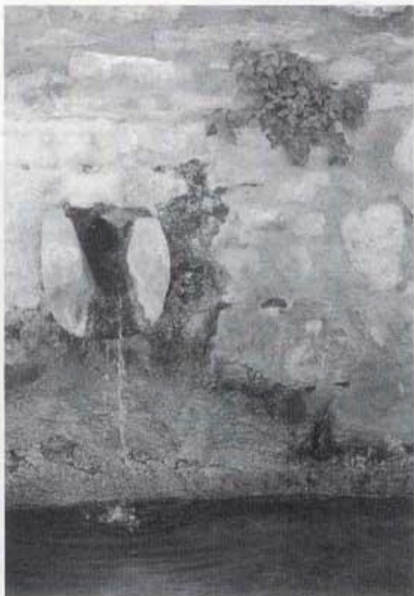
Abeuradors Font de la Vila.