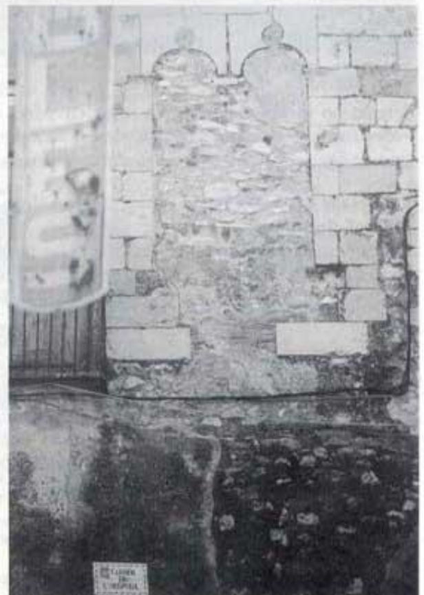
Finestra, Casa "Senyorettes de Don Miquel".